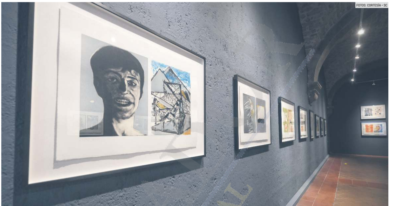
EXPOSICIÓN. La muestra ofrece la visión conjunta de diversos talentos.

“Creo que hay muchísima gente que, aunque no tenga la capacidad económica para comprar una pieza de arte, sí puede