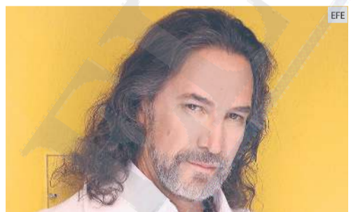
MARCO ANTONIO SOLÍS. El “Buki” lamentó la violencia ocurrida en el estadio.