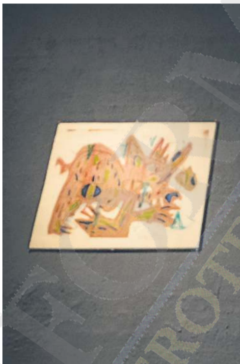
“OXÍMORÓN”. El Ex Convento del Carmen se engalana con una muestra de linotipias, cada una con un espíritu propio y un interesante proceso creativo.

comprar una monotipia, porque no es cara. Tendremos precios muy accesibles con la finalidad de buscar que las personas más jóvenes se animen a comprar, que comiencen a ser coleccionistas de un artista jalisciense”, refiere Natalia, al detallar que tras su