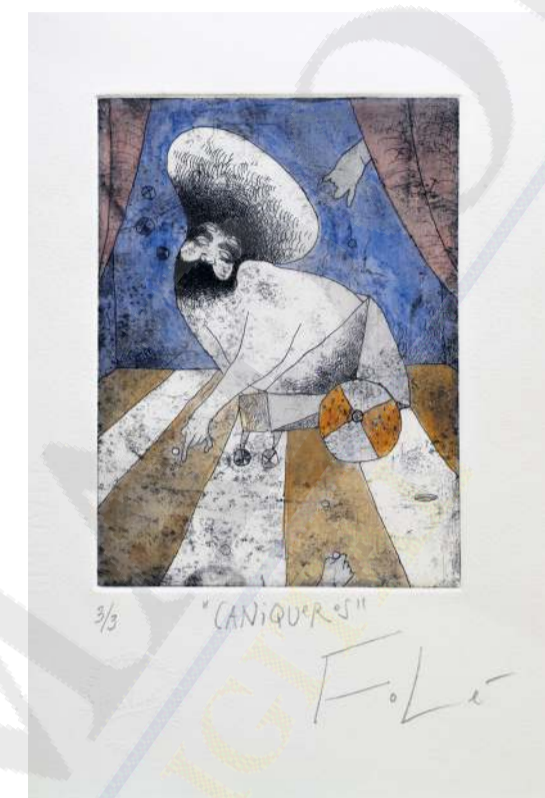
CANIQUEROS. Obra de Folé.